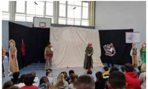
Unterstützung eines Präventionstheaters an der Mittelschule Poing.