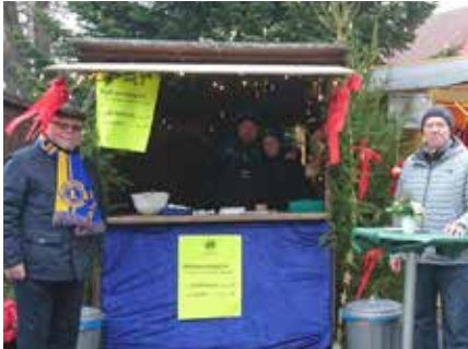
Verkauf von Reiberdatschi auf dem Weihnachtsmarkt Ebersberg.