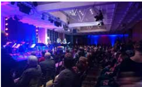
Konzert des Grafinger Jugendorchesters: Zum Start der Spendenaktion „Kette der helfenden Hände“ in Zusammenarbeit mit dem Münchner Merkur Ebersberg.

Die dafür notwendigen Gelder stammen aus Mitgliedsbeiträgen, Spenden und den Erlösen, die durch besondere Veranstaltungen wie z.B. Benefizkonzerte, und andere Aktivitäten (Produktion eines Adventskalenders, Spendenaufrufe, Verkaufsstände) erzielt werden. Spenden an das Ebersberger Lions Hilfswerk e.V. sind steuerbegünstigt.