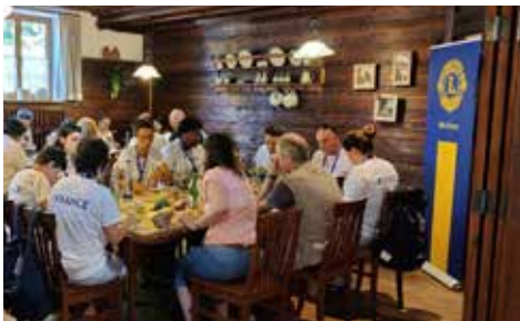
Einladung der Special Olympics Teilnehmer zum Frühstück im Clubraum der Lions, im Stüberl der Ebersberger Alm.

Darüber hinaus hilft er im Rahmen seiner Möglichkeiten überall dort, wo aktuelle Ereignisse es nach Ansicht seiner Mitglieder erfordern oder wo (nicht staatliche) Einrichtungen bzw. auch Personen einer besonderen Förderung bedürfen. Dies tut er grundsätzlich überparteilich und ohne Ansehen der Religion. Durch seine Beiträge an Lions International wirkt er überdies an über-