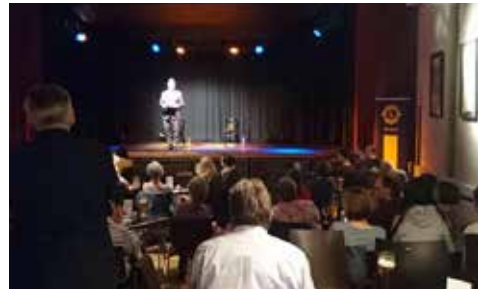
Benefizveranstaltung des Lionsclub Ebersberg: Szenische Lesung „Welcome To Paradise“ mit Flüchtlingen und Asylbeamt*innen im Alten Kino Ebersberg.

Regelmäßig (am ersten und dritten Mittwoch des Monats in der „Ebersberger Alm“) treffen sich die Mitglieder zu Diskussionen und Vorträgen über Themen aus Politik, Wirtschaft, Ökologie, Geschichte und andere zusammen, für die oft hochrangige Referent*innen gewonnen werden. Gäste sind hier stets herzlich willkommen. Interessent*innen, auch für eine eventuelle Mitgliedschaft, finden weitere Informationen auf der Homepage.